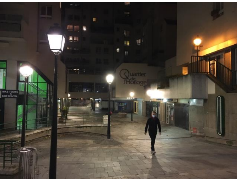
Un quartier privé avec l'éclairage public. Rien n'est simple dans le Quartier de l'Horloge.

L'ASL gère le relevé des compteurs individuels des commerces et des bureaux, puis elle délègue à un syndicat de copropriété la facturation des consommations électriques auprès des bénéficiaires. Une situation qui serait en désaccord avec la jurisprudence actuelle qui impose le raccordement direct au réseau électrique de chaque consommateur final d'électricité.